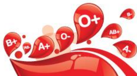
% AB Plasma Issues of Total Plasma Issues